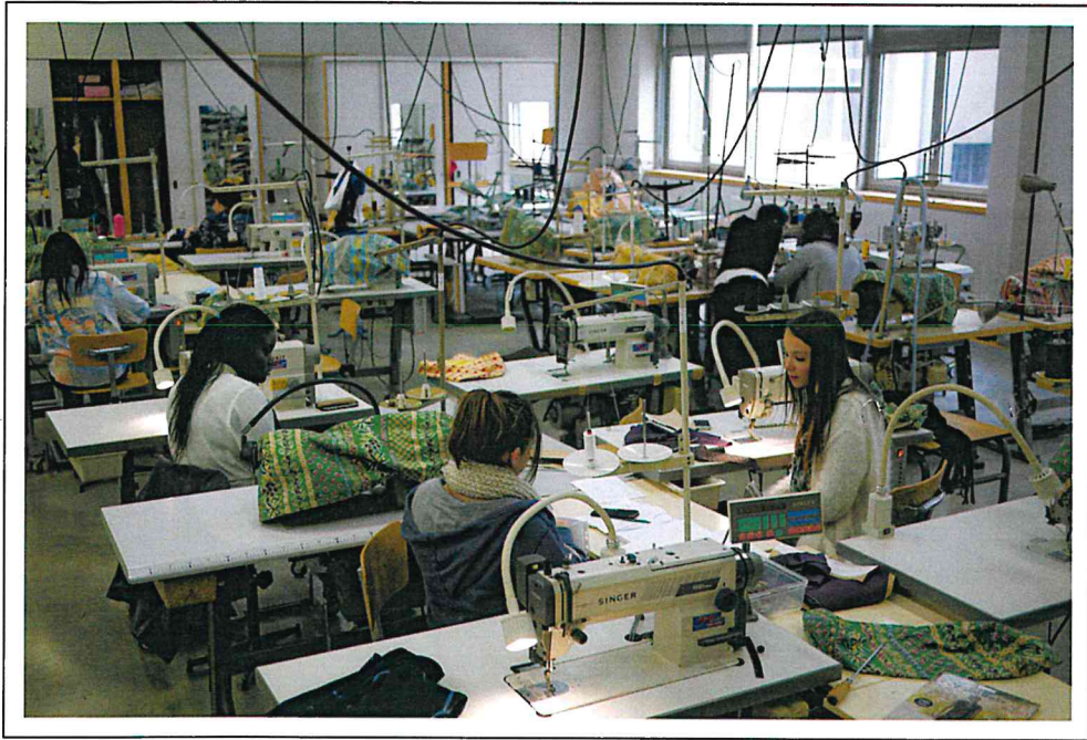
Les enseignements technologiques et professionnels en cours et en ateliers représentent 12 heures de formation hebdomadaire.