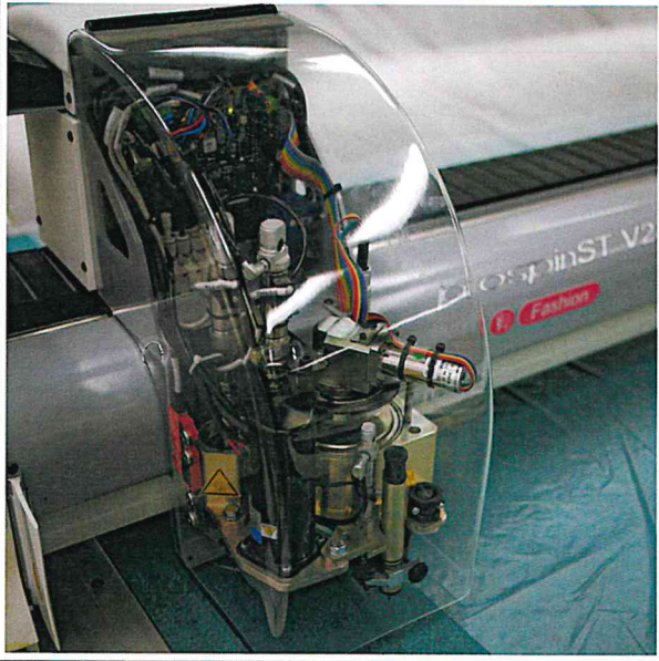
Tête de découpe