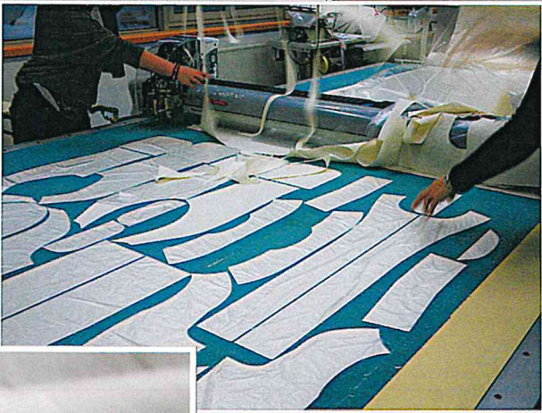
Découpe assistée par ordinateur